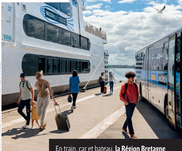
© SCOPIC - Crédits photos - Oloa Stuedo/Stock - Septembre 2022

En train, car et bateau, la Région Bretagne transporte chaque année 60 millions de voyageurs grâce à BreizhGo, son réseau de transport public.